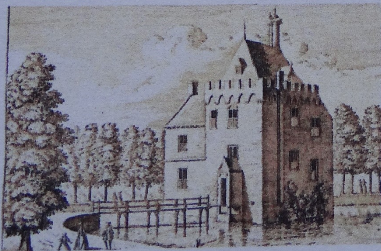
De voorzijde van het kasteel De Boekhorst. De gravure werd in 1732 door Abraham Rademaker gemaakt.

Meer recent verbaast het Van der Elst dat baron van Hardenbroek na een ruzie met de gemeente als eigenaar van het landgoed opdracht gaf om het hoog aangeschreven Boekhorsterbos te kappen. „Hoppa, gewoon weg. Ik hou ook erg van de natuur en dan is het jammer dat zo'n mooi duingebied gewoon is verdwenen.”